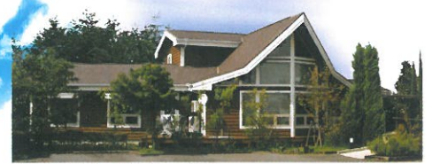
大府市 ゆき皮フ科クリニック様